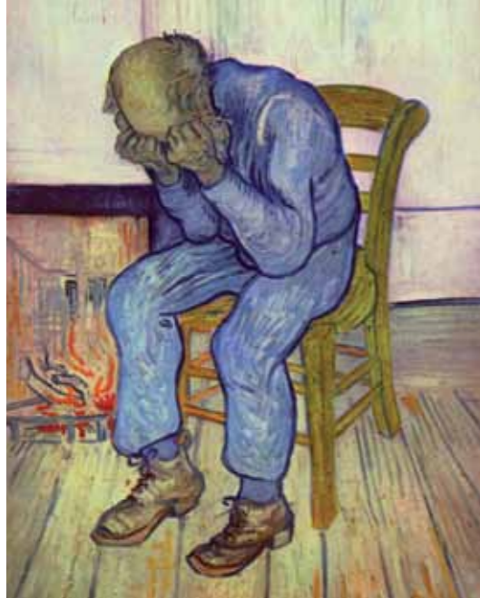
Vincent van Gogh: Trauernder alter Mann (At Eternity's Gate), 1890